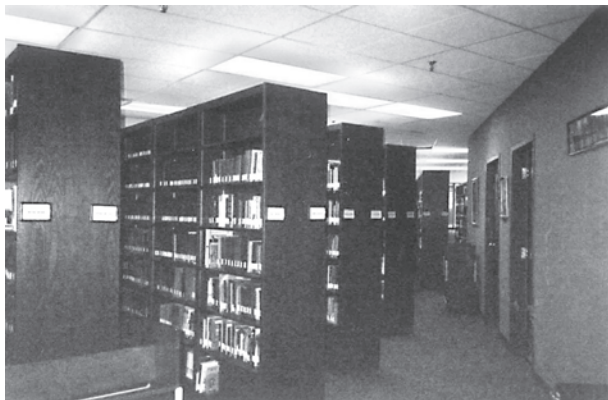
南部バプテスト歴史図書館

ナッシュビルの空港からタクシーを20分ほど走らせると、目的地の南部バプテスト連盟事務所に着く。近くにはアメリカ有数のカントリー・ウェスタン・ミュージックの本場ナッシュビルのダウンタウンもあり、夕刻になるとその一帯は、カントリー・ミュージックが流れ、世界中から集まってくる観光客で溢れる毎日である。そのような市内の中心に南部バプテスト連盟事務所がある。歴史図書館は、月曜日から金曜日までの毎日、朝9時から午後4時まで開館している。ここには、世界各国のバプテスト関係の資料に加えて、南部バプテスト連盟公文書（1948年～1996年）、25,000冊を超える書籍、71,000点以上のバプテスト地方連合・州連合・連盟の各定期総会議事録、バプテスト地方連合や関係事業体の新聞、ビデオ、録音、写真、パンフレットがあり、