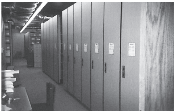
膨大な資料が収められた書庫