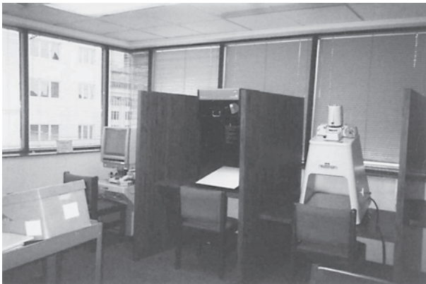
マイクロフィルムなど整った設備

図書館にはコピー機、マイクロフィルム映写機、マイクロフィルム用スキャナー、リサーチルーム、視聴覚室、コンピュータが備えられており、リサーチの環境が整えられている。リサーチを始めるにあたり、学芸員が丁寧にオリエンテーションをして助けてくれる。図書館司書は大変よく訓練されており、閲覧したい資料のテーマや人名を言うと、図書館奥の書庫から必要なものをすべて取り出してきてくれる。それで足りない時には、もう少し絞り込んだ情報を与えると、億劫がることなく何度も書庫と閲覧室を往復して、利用者のリサーチを助けてくれるのありがたい。リサーチで疲れると、同じ階にあるブレイクルームに行くことができる。無料のコーヒーと紅茶が用意されており、スナックやソフトドリンクの自動販売機もある。