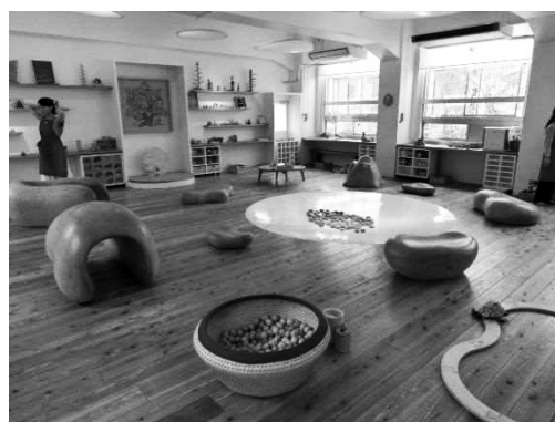
写真① 子育て支援施設 B 内部

A市にある木育をコンセプトとした木育子育て支援施設 B（写真①）に来場した親子13組を対象とした。本施設の経営母体は認定 NPO 法人で、赤ちゃんからお年寄りまでが人と出会い、遊びを通して文化を知ることが目的とした美術館（6 か月児から入場料が必要）である。木育子育て支援施設 B はその美術館内にある 1 室で、美術館内の他の施設利用に年齢制限はないが、この部分のみ 0～2 歳児を対象としている。開設当初は開館時間内であれば何時間でも利用できたが、年々来場者が増えたことにより、現在は一家族 1 日 1 回 90 分間の利用となっている（その他のエリアは 1 日利用可能）。これは、木育環境の中で来場する親子がゆっくり遊ぶことができるという施設側の意向である。