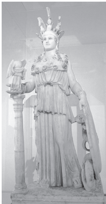
図12 〈アテナ・パルテノス〉紀元前447-432年頃、ローマンコピー、高さ104cm、アテネ国立考古博物館