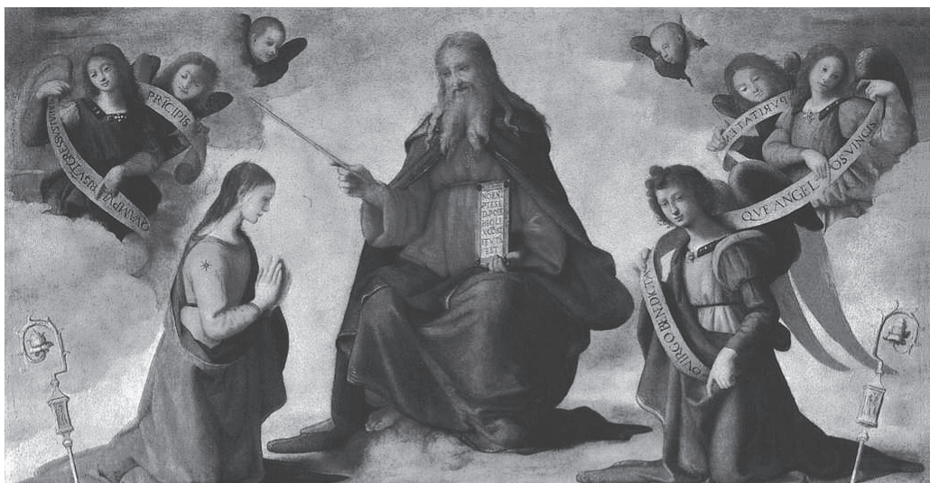
図3 神を中央に据えた左右対照的な構図(図1上部)