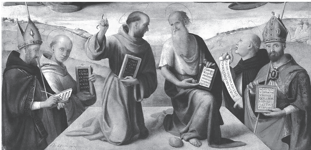
図2 「無原罪の御宿り」について議論する教会博士たち(図1下部)