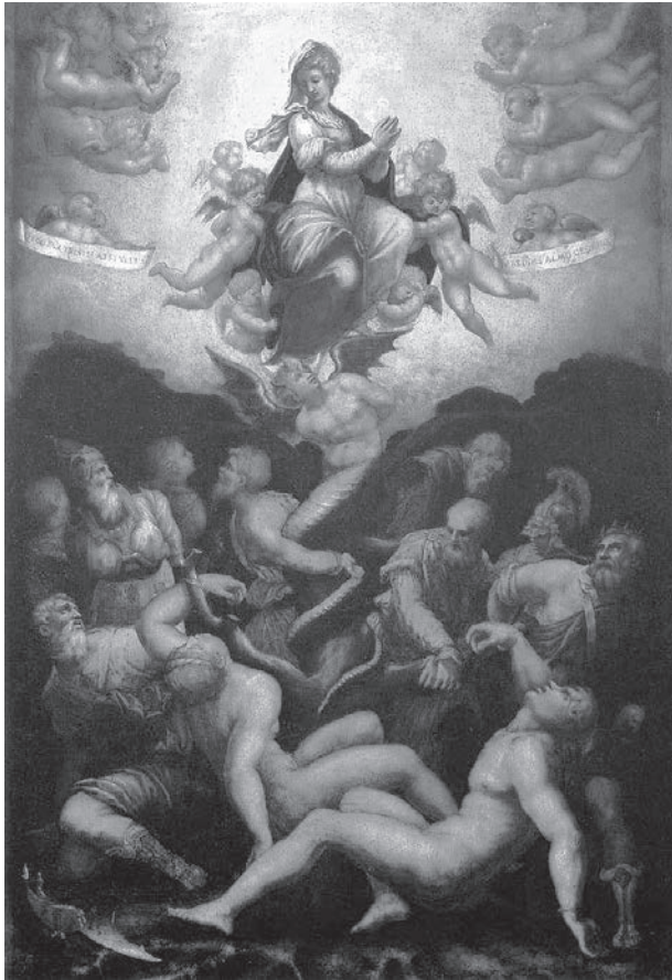
図6 ジョルジョ・ヴァザーリ《無原罪の御宿り》1541年、58×39 cm、フィレンツェ、ウフィツィ美術館

であったが、ヴァザーリは苦心の末に完成することができた。それは画面の中央に原罪の木を立て、その根元には神の命令を最初に破ったアダムとイヴが裸でつながれているもので、さらに別の枝にはアブラハム、イサク、ヤコブ、モーセ、アロン、ヨシュア、ダビデ、そのほか旧約聖書の王たちが古い順に次々とその両手を縛られている。しかしサムエルと洗礼者ヨハネの二人は母の胎内で聖別されていたために、例外的に片方の腕だけを縛られている。その木の幹には、上半身が人間の姿をした旧約聖書の蛇が尾をまきつけ、その両手を後ろで縛られている。そしてその角を踏みつけるのは、彼の頭上に輝く栄光の処女マリアの片足だ。マリアは太陽を身に纏い、十二の星の冠を戴き、もう片方の足は月の上に乗っている。彼女は多くの裸の小天使たちの輝きの中で宙吊りになり、天使たちはマリアの発する光線に照らされる。このマリアの光線はさらに、木の葉のあいだを通して、木につながれた者たちをもまた同じように照らし出す。こうして彼らは、マリアからも