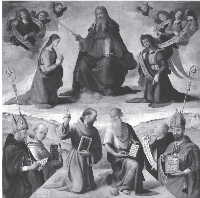
図1 ピエロ・ディ・コジモ《無原罪の御宿り》1510年頃、184×178 cm、フィエーゾレ、サン・フランチェスコ聖堂