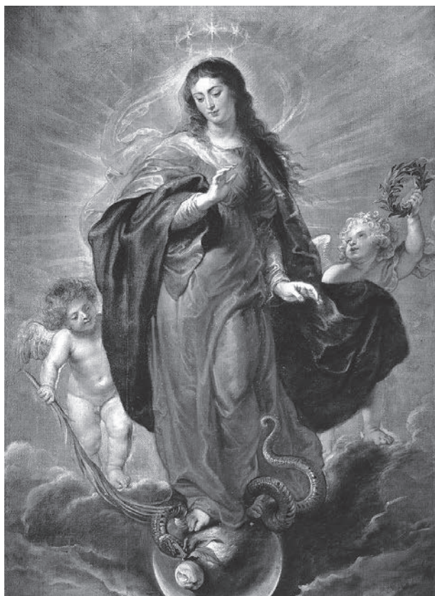
図10 ピーテル・パウル・ルーベンス《無原罪の御宿り》1628年頃、198×137 cm、マドリッド、プラド美術館