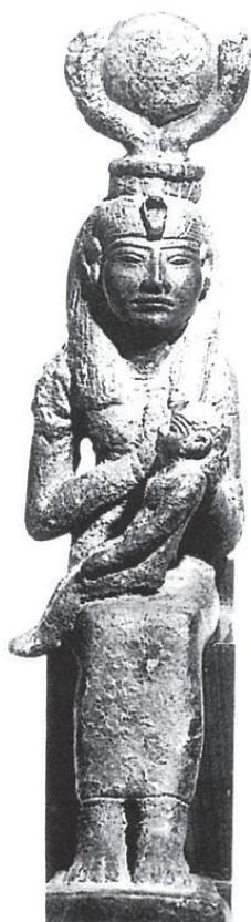
図11 〈授乳するイシス〉27-30王朝、トリノ、エジプト美術館

女の古い表象には、今日親しまれている兜の戦女神ではなく蛇を纏ったものがある。また戦士としての女神として表象されるときも、彼女は蛇と共にあった【図12】。アテネは英雄ペルセウスのメドゥーサ退治を助け、蛇髪が生えたその怪物の頭を貫き受ける。この怪物の首は、彼女が伝統的に纏う山羊皮のマントもしくは楯に飾られ、勲章のように見る者を威圧する。彼女は知恵の女神でもあった。彼女の名を冠する都市国家アテネの伝説上の王たちはしばしば半身半蛇の姿で生まれたし、都市に暮らす人びとは、蛇を彼女の聖域で大切に飼い、都市国家の命運を占わせていた 34 。彼女の怒りに触れたラオコーンは彼女の蛇によって息子共々殺される。そしてこの異教の女神たちの血脈はマリアの中に流れている。玉座の聖母子像の起源は母なる女神イシスまで遡ることができるし、母親の子宮からではなく父親の頭部から誕生した女神アテネは、男たち(父なる神、英雄)による女(女神、母)の支配を奨励する女神であった。マリアは《無原罪の御宿り》で異教の敵である蛇と女神