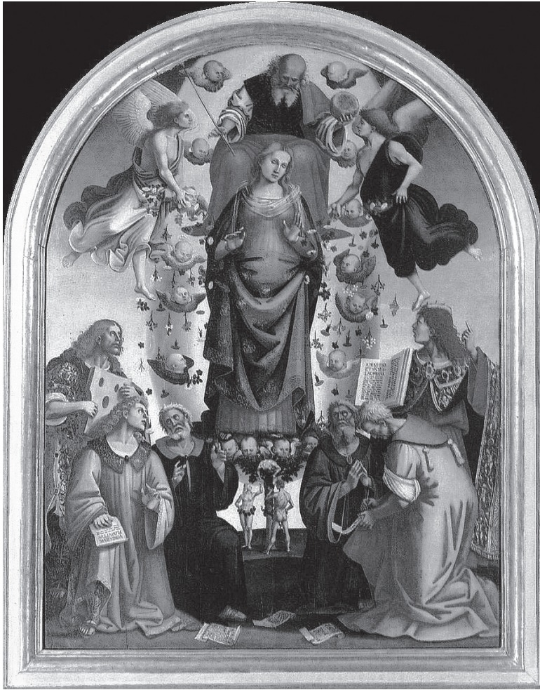
図4 ルカ・シニョレッチ<無原罪の御宿り>1523年、 217×210 cm、コルトーナ、ディオチェザーノ美術館