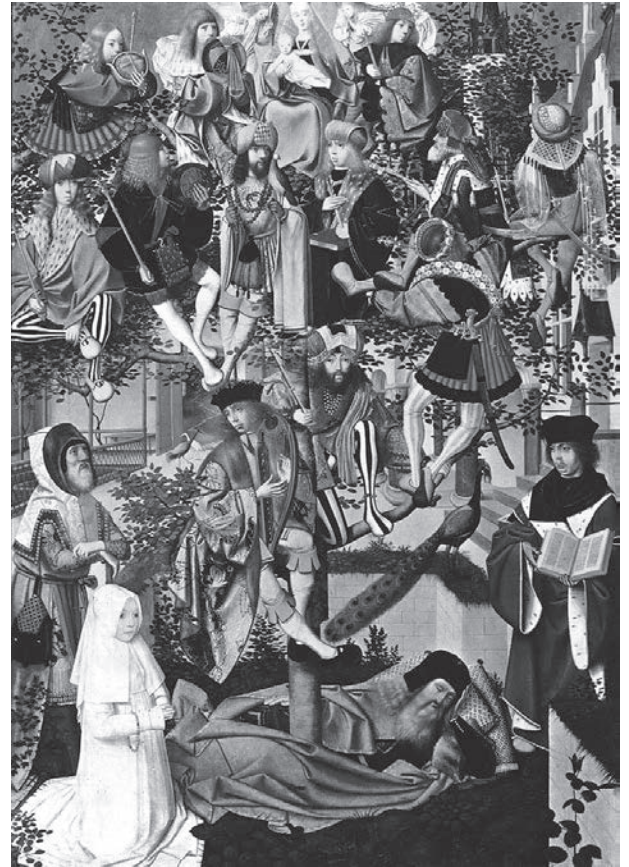
図8 ヘルトヘン・トット・シント・ヤンス《エッセイの木》1480年頃、89×59 cm、アムステルダム、国立美術館

徴ともなる 27 。伝統的なエッセイの木の図像【図8】では、地面に横たわり系樹の根となるのはエッセイである。しかしヴァザーリの《無原罪の御宿り》では、アダムそしてイヴがエッセイの代わりに株となり、その枝に子孫たちを括り付けている。だがマリアだけは変容することなく、輝ける若枝として天上で輝き続け、特別な母親、処女として聖別されるのだ。