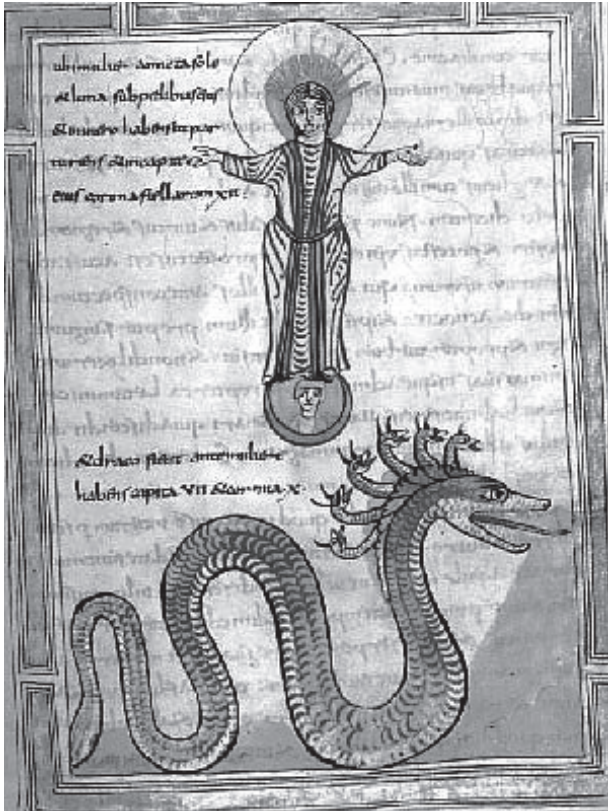
図7 「黙示録の女(太陽を身にまとう女)」ヴァランシエンヌ写本、9世紀、ヴァランシエンヌ市立図書館、Ms.99