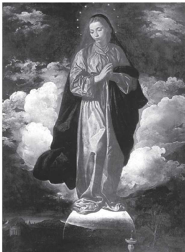
図9 ディエゴ・ベラスケス《無原罪の御宿り》1618頃、134.6×101.6cm、ロンドン、国立絵画館

ディエゴ・ベラスケス(1599-1660年)の処女作品のひとつに《無原罪の御宿り》(1618頃)【図9】がある。この作品が描かれたのはパチェコの『絵画術』が出版される前ではあるが、彼の「無原罪の御宿り」の図像に関する理解はパチェコの影響を受けているといっても過言ではないだろう。ベラスケスはパチェコの弟子であり、パチェコの娘であるフアナと結婚した彼の義理の息子でもあるのだ。ベラスケスが《無原罪の御宿り》を描いたとされる年は、彼がパチェコから独立した翌年のことである。ベラスケスの《無原罪の御宿り》の「絵の中で聖母は落ち着いた、崇高な姿をし、紅の陰影のついた白いガウンと青のマントをまとい、太陽を背に月の上に立っている。その顔は金褐色の頭髮に縁どられ、両手は、なめらかな画法によってひびもなく、清い、いわば愛らしい形をしている」 30 。「満月のように美しく、太陽のように輝く」[雅歌6.10]くマリアの足元の月は画面底辺部で透け入り、そこには濃淡の境の中に聖女の連禱—それは「閉ざされた庭」「園の泉」や「命の水の井」 31 、エッサイの木だろうか—が表象されている。ベラス