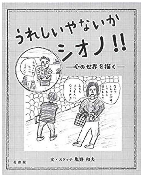
塩野和夫『うれしいやないか シオノ!! —心の世界を描く—』