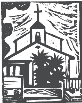
『伊予吉田教会90年史』

教会を生み、立て、活動してきた根本動機に共鳴しながら、共鳴する心で表現することです。