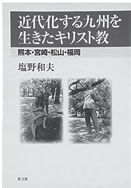
塩野和夫『近代化する九州を生きたキリスト教—熊本・宮崎・松山・福岡』

本論である「第2章 熊本ステーション関連記事 (1888-1898年)」、 「第3章 宮崎ステーション関連記事 (1896-1900年)」、 「第4章 松山ステーション