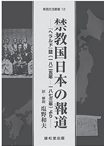
塩野和夫『禁教国日本の報道 —『ヘラルド』誌（1825年—1873年）より—』

者ならではの気持が生きいきと描かれています。同様に「記事8 函館描写」（1855年3月号）は提督ペリーの通訳として来日し、1854年5月17日から6月3日にかけて函館を調査したウィリアムズによって当時の函館の町の様子が報告されています。